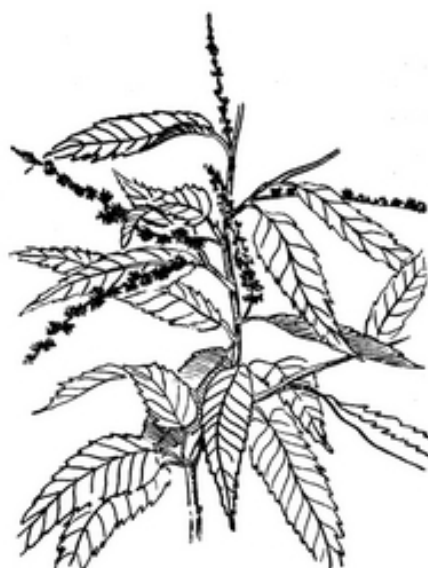
Εἰκ. 2504. Καστανέα ἡ προιονόφυλλος ( Castanea crenata ) κλαδίον ἐν ἀνθήσει

Ἀπὸ παλαιοφυτικῆς ἀπόψεως ἡ Καστανέα ἦτο ἄφθονος εἰς τὰς ἀρκτικὰς χώρας κατὰ τὸν τριτογενῆ αἰῶνα. Ἀνευρέθησαν εἰς