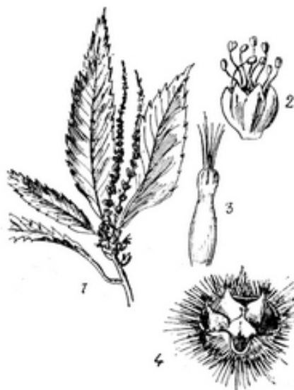
Εἰκ. 2501. Καστανέα ἡ ἐδώδιμος. ( Castanea sativa )

Κ. ἡ ἐδώδιμος ( C. sativa Mill., C. vulgaris Lamk., C. vesca Gaertn., C. Castanea Karts. γαλλιστὶ Chataignier ἢ Marronnier, ἀγγλιστὶ Chestnut Tree, European Chestnut, Sweet-chestnut, γερμανιστὶ Edel Kastanie Εἰκ. 2501 ) τὸ γνωστὸν ὡς καστανιά δένδρον, 20—25μ. ὕψους, μὲ κόμην ἀπλωτὴν, συμπαγῆ, μὲ κοιμωμένους ὀφθαλμοὺς μεγά-