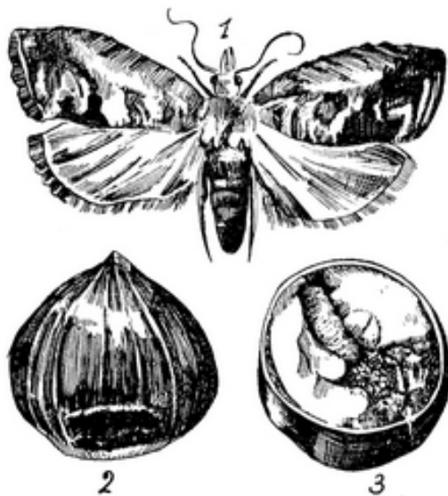
Εικ. 2502. Έχθροί της Καστανέας Καρπόκαψα ή στίλπη (Carpocapsa splendana) 1, άκμαίον. 2, άσθενές κάστανον. 3, έγκαρσία τομή του ίδίου ένθα διακρίνεται ή έν αύτῷ προνύμφη.

Πλην όμως της παθήσεως αύτης, ήτις είναι μία επικίνδυνος άπειλή διά τάς καστανοκαλλιέργειας της έδώδιμου ή κοινής καστανάας και έτεροι μικρομύκητες άποβαίνουη ένίοτε έπιβλαβείς, μειούητες σοβαρώς